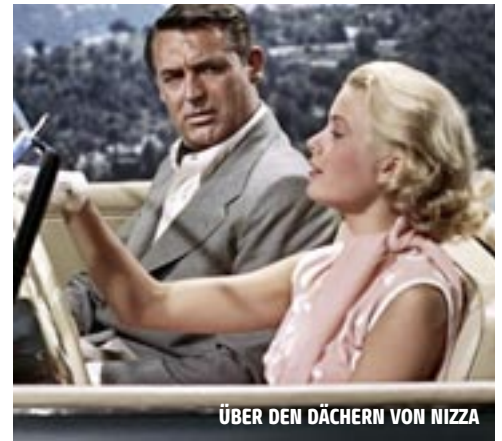
ÜBER DEN DÄCHERN VON NIZZA