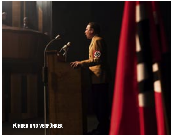
FÜHRER UND VERFÜHRER